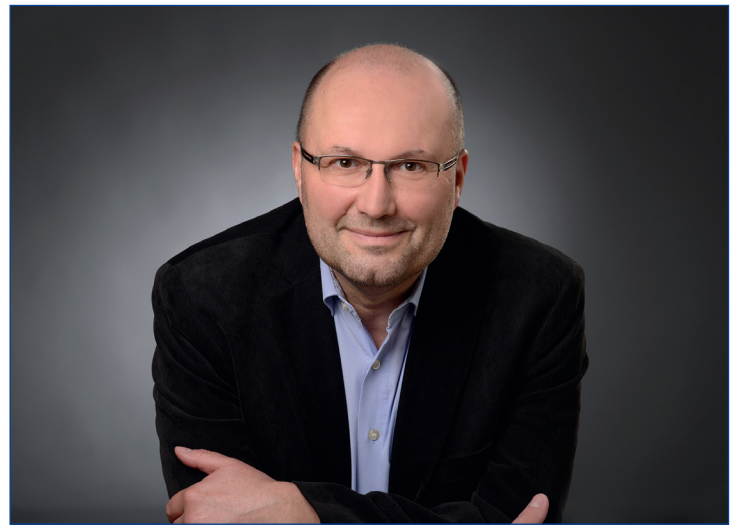
Zur Person des Weiterbildungsleiters

Van der Kolk, Bessel A. (2016): Verkörperter Schrecken. Traumaspuren in Gehirn, Geist und Körper und wie man sie heilen kann . G. P. Probst Verlag: Lichtenau/Westf.